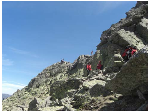
Descenso del Risco de Claveles