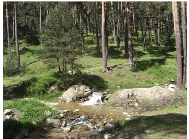
Cruce del camino por el Arroyo Carneros