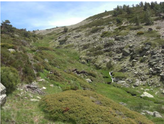
Descendiendo junto al Arroyo de la Chorranca