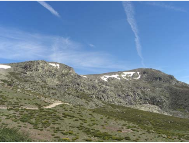
Dos Hermanas subiendo por la pista hacia Peñalara