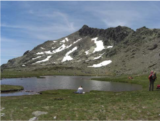
Risco de Claveles y Laguna de Los Pájaros