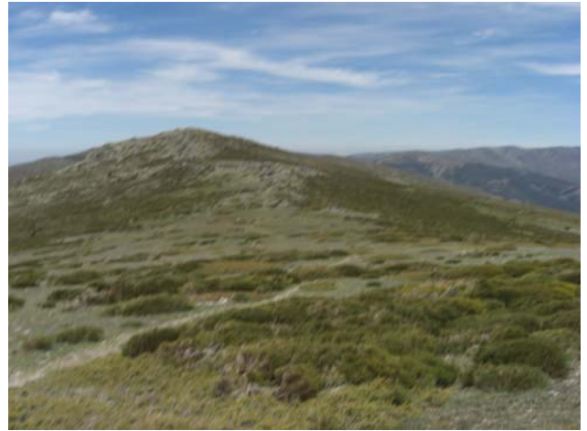
El Puerto de Los Neveros y Los Neveros