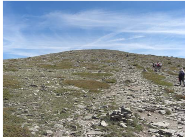
Ascendiendo por la loma al Pico de Peñalara