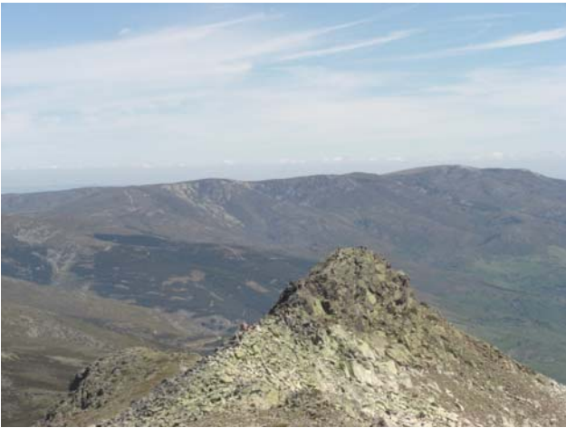
Risco de Claveles desde la cumbre de Peñalara