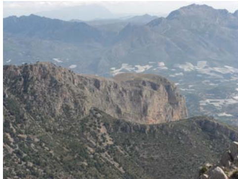
El Ponoig y Gallosa d'En Sarria desde la cumbre