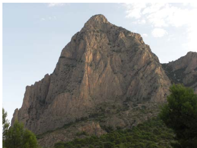
Cumbre Oeste del Puig Campana desde Finestrat