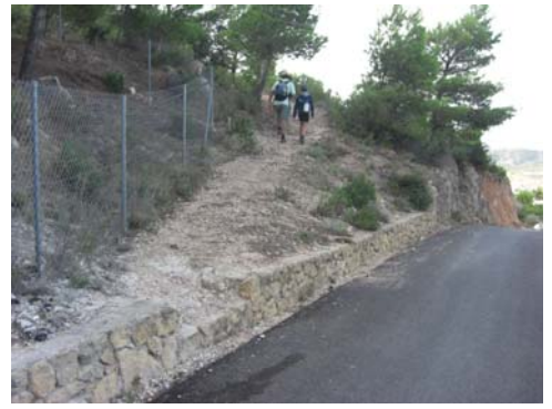
Desvío de la senda en Urbanización