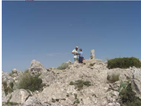
Cumbre del Puig Campana