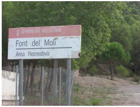
Inicio de Opción por Area Recreativa