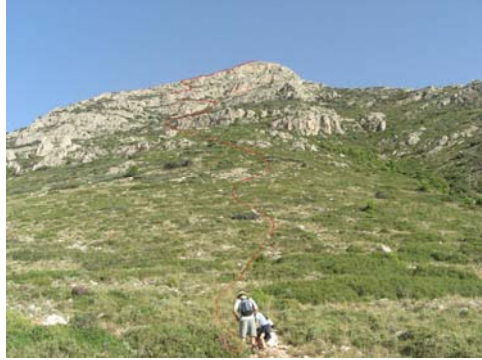
Ruta de la ladera Este