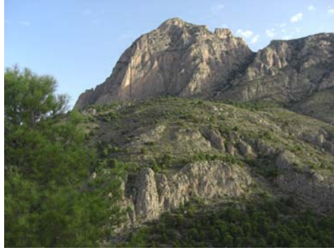
El Puig Campana desde la senda del Este