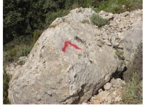
Marcas rojas de la senda de ascenso