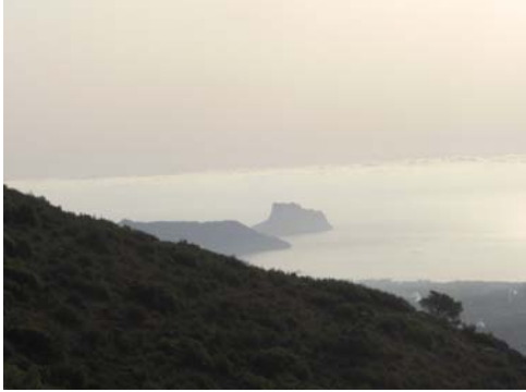
El Peñón d'Ifach desde el sendero