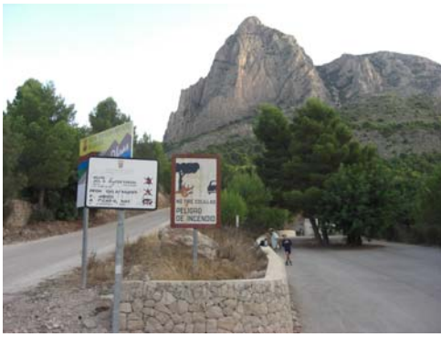
Aparcamiento de Font dels Molins