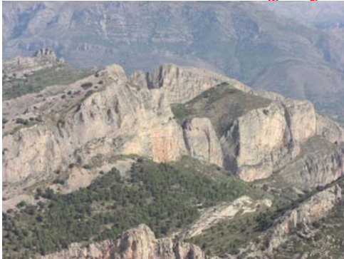
Proximidades de Sella desde la cumbre