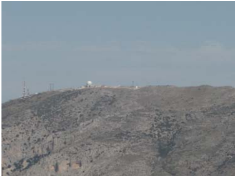
El Pico Aitana desde la cumbre del Puig Campana