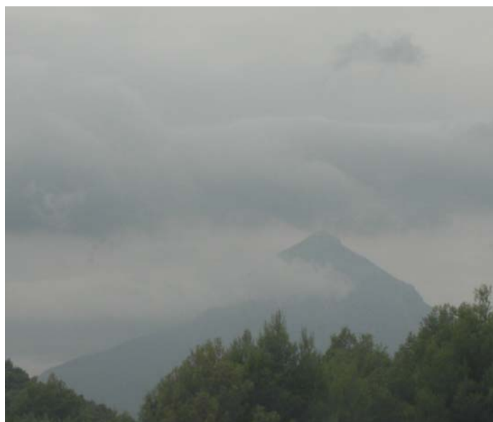
Cumbre Principal del Puig Campana desde Altea