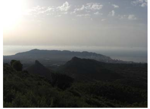
Zona de Benidorm desde el sendero