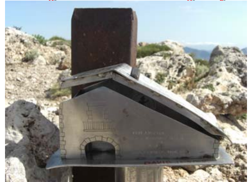
Buzón de Cumbre del Puig Campana