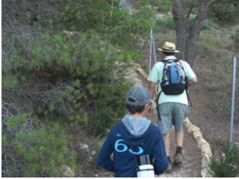
Paso del sendero junto a un chalet