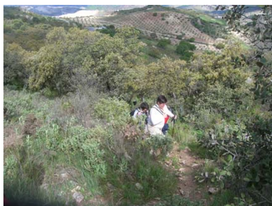
Senda inicial. Se ven los vehículos al fondo