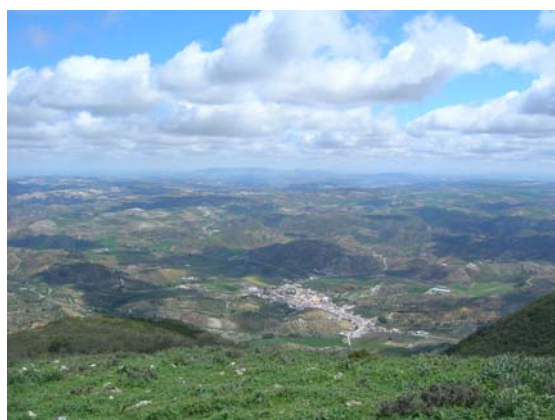
La población de Algámitas desde el Terril