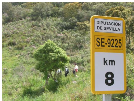
Referencia del inicio de la ascensión al Terril