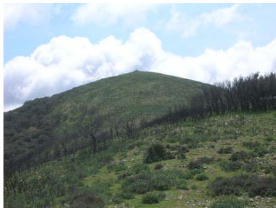
Loma y cumbre principal del Pico Terril