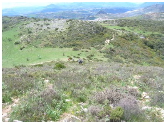
Subida por la loma desde el primer collado