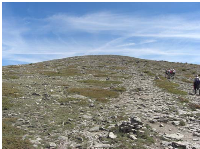
Ascendiendo la loma a la cumbre de Peñalara