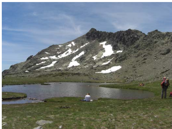
La Laguna de Los Pájaros y el Risco de Claveles de fondo