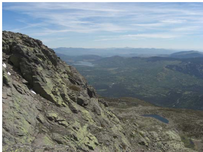
Vista de Cinco Lagunas desde Peñalara