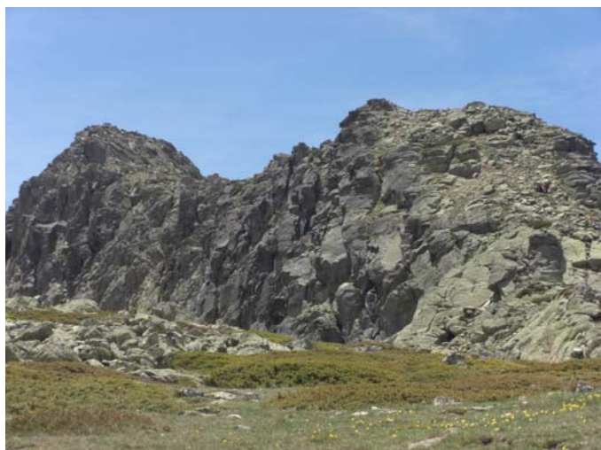
El Risco de Claveles y el Risco de Los Pájaros