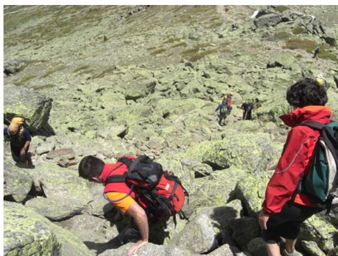
Descendiendo los bloques de la cumbre del Risco de Claveles