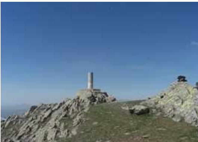
Cumbre de la Peña de la Cabra