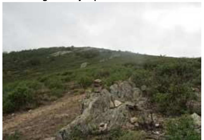
Hito señalando el sendero al Cerro de las Cabezas