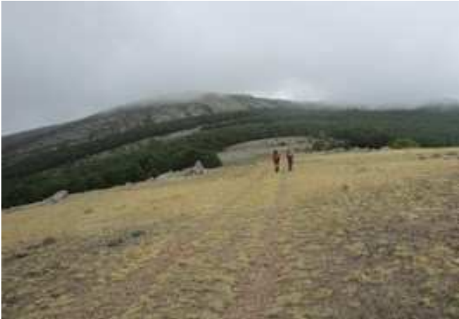
Ascendiendo por la pista hacia el pinar