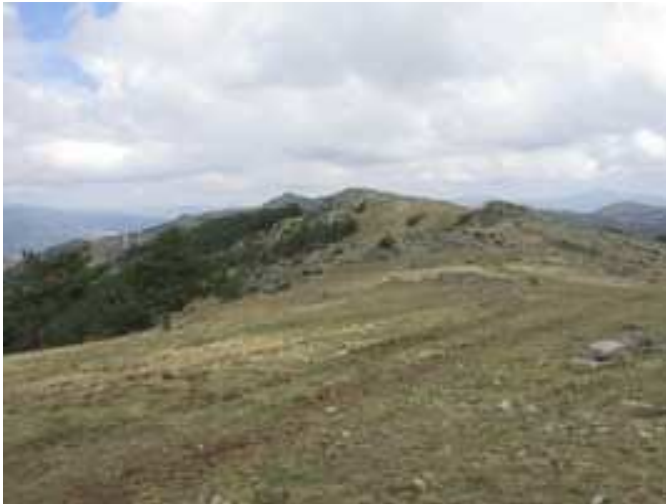
Zona de Peña Cuervo y Las Pedrizas