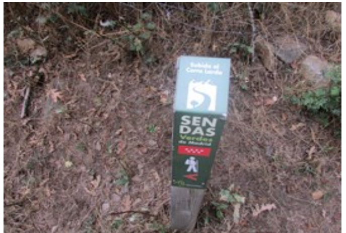
Señalización de la senda a seguir