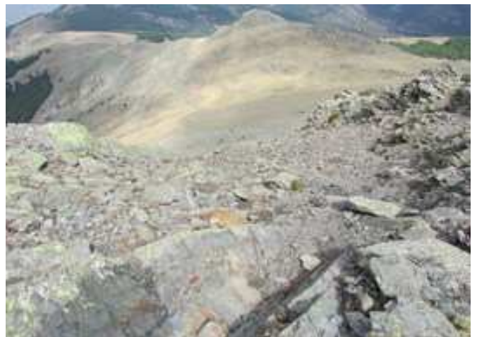
Tramo de descenso por la vertiente Norte de Peña La Cabra