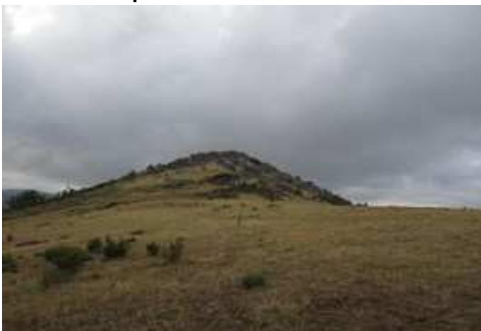
Vista del Cerro de las Cabezas desde el Collado de Larda