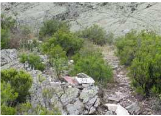
Parte superior del Cerro de las Cabezas