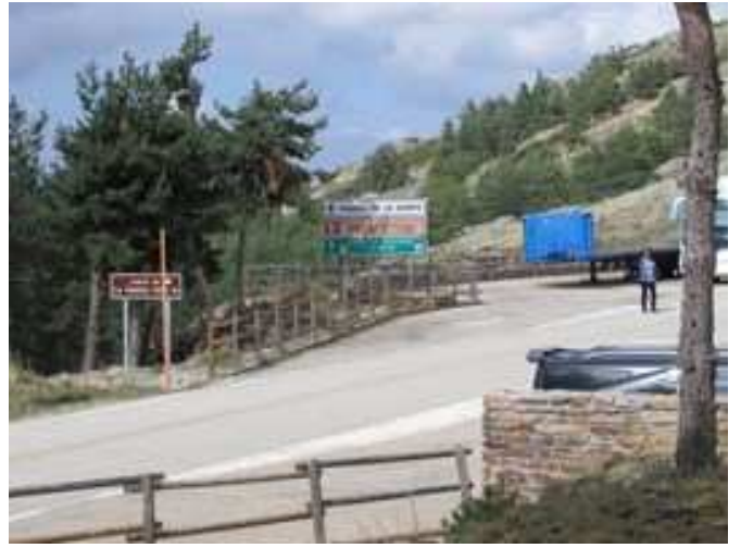
Aparcamiento del Puerto de la Puebla