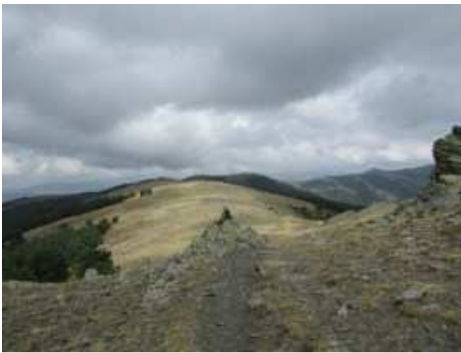
El sendero llegando al Collado de la Tiesa