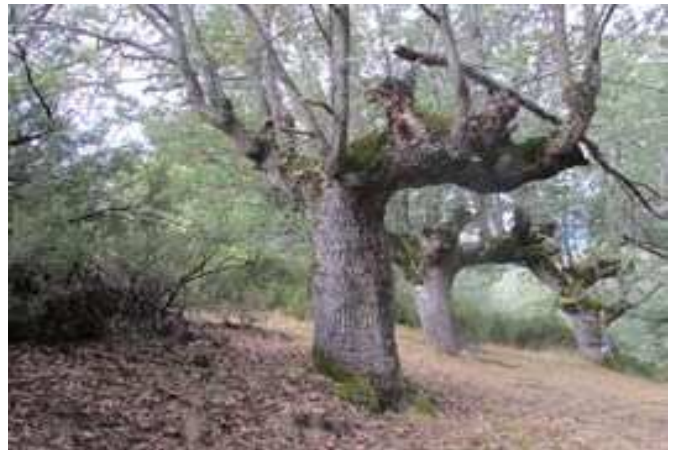
Algunos ejemplares del robledal