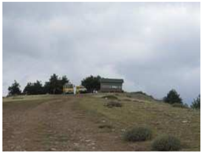
Caseta de vigilancia forestal