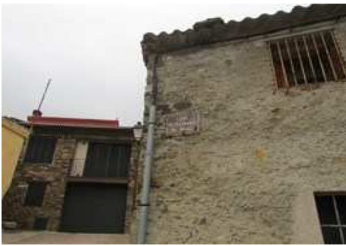
Indicación de la Calle de la Fuente de Abajo