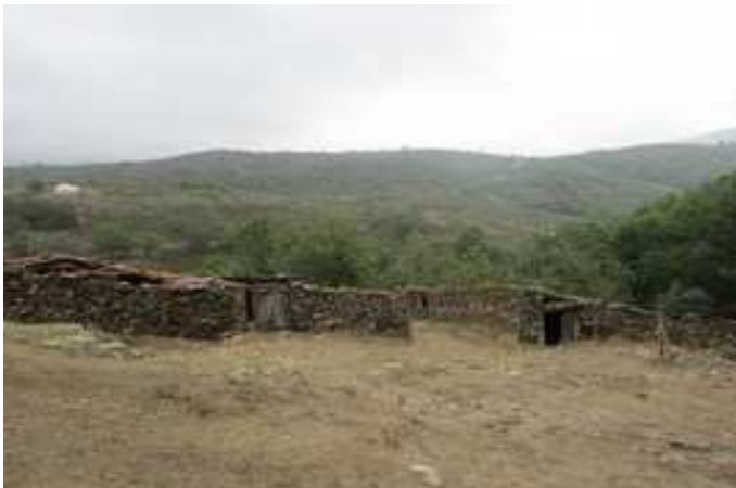
Cabañas próximas al sendero de subida