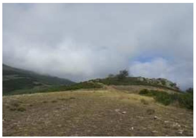
Pista a tomar en el Collado Valtejoso