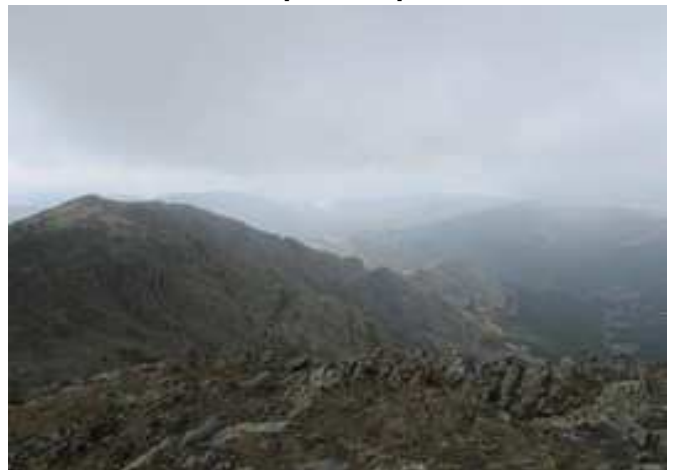
Vistas al sur llegando a la cumbre