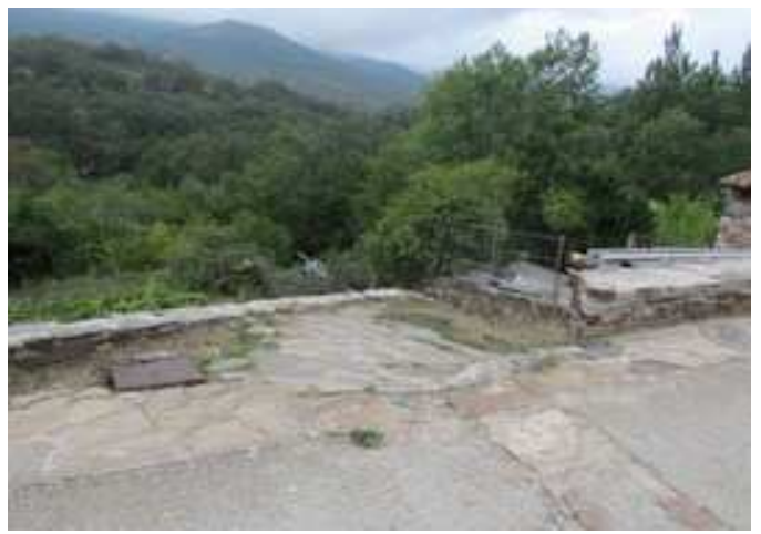
Frente a la casa anterior, inicio de la ruta