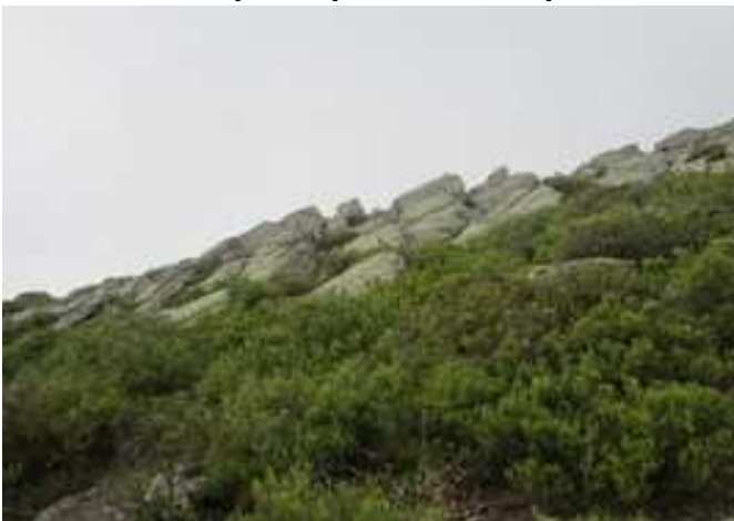
Inicio de la subida a la Peña de la Cabra