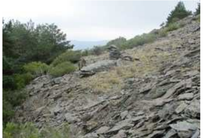
Hito a la salida del pinar al pie de Peña Cabra