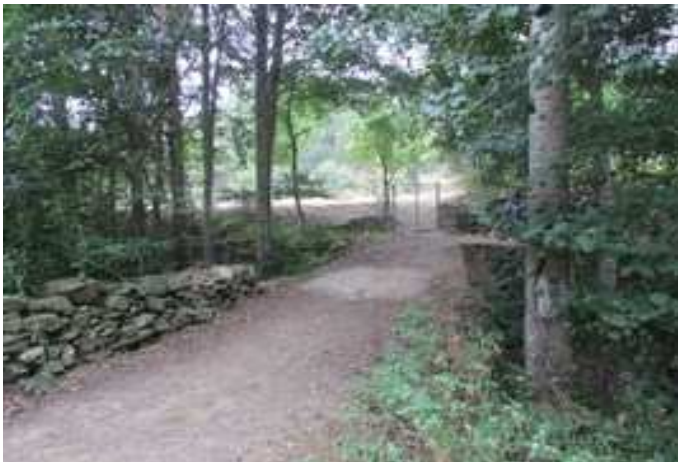
Paso del puente sobre el Río de la Puebla