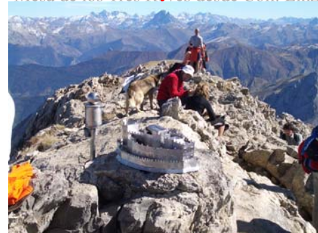
Collado de Budogía y cumbre de la Mesa, Trepada final a la cumbre de la Mesa, Cumbre de la Mesa de los Tres Reyes,