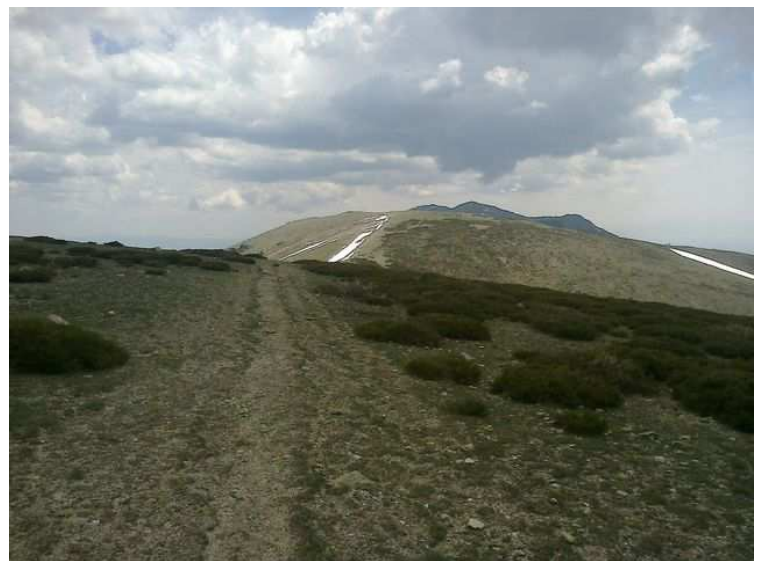
Sendero hacia Valdemartin en la Guerda Larga