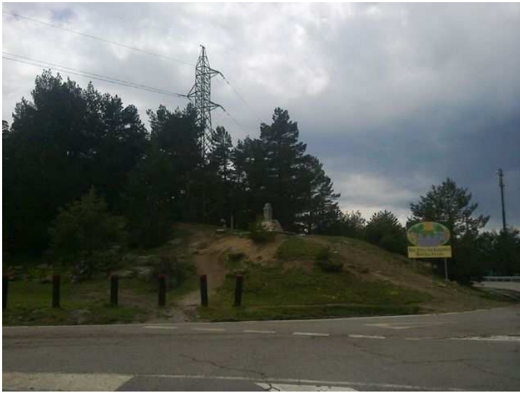
Inicio de la ruta en el Puerto de Cotos