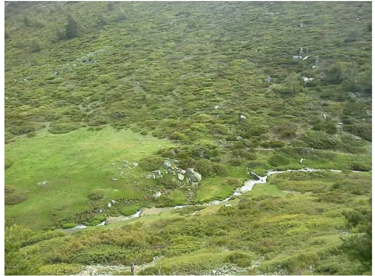
Descendiendo hacia el aparcamiento de Valdesquí El sendero bordeando el Arroyo de las Guarramillas