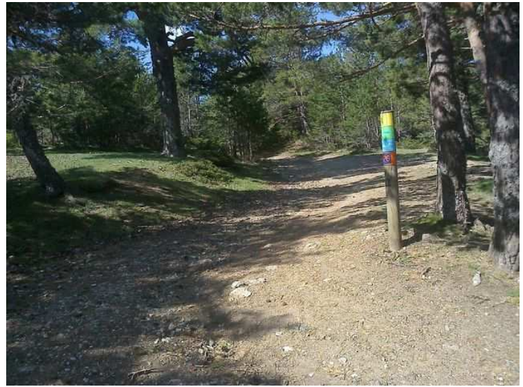
Cruce de la pista con el sendero de la Loma del Noruego