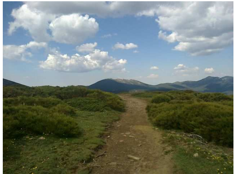
Loma del Noruego, Siete Picos y Mujer Muerta