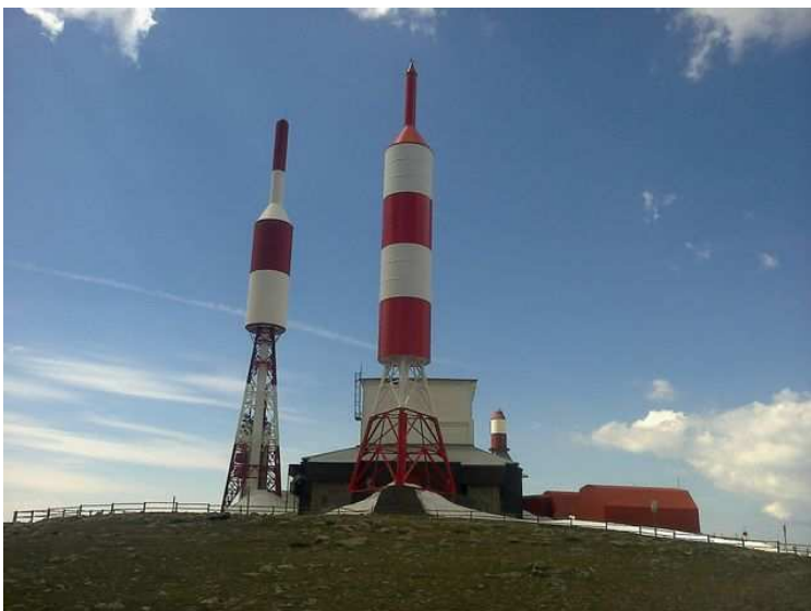
La Bola del Mundo en el Alto de las Guarramillas