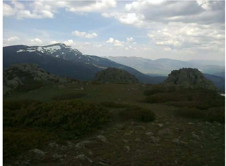
Llegada al Cerro de Valdemartín Riscos a pasar. El último por su izquierda.