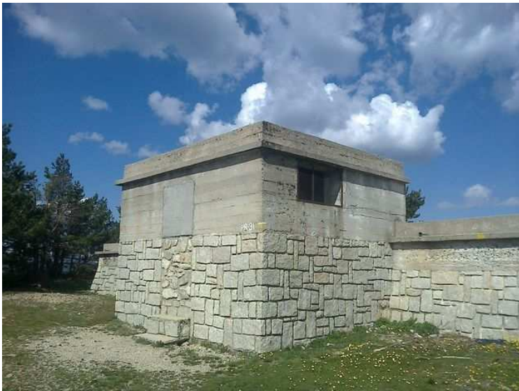
Construcción situada en el Altozano