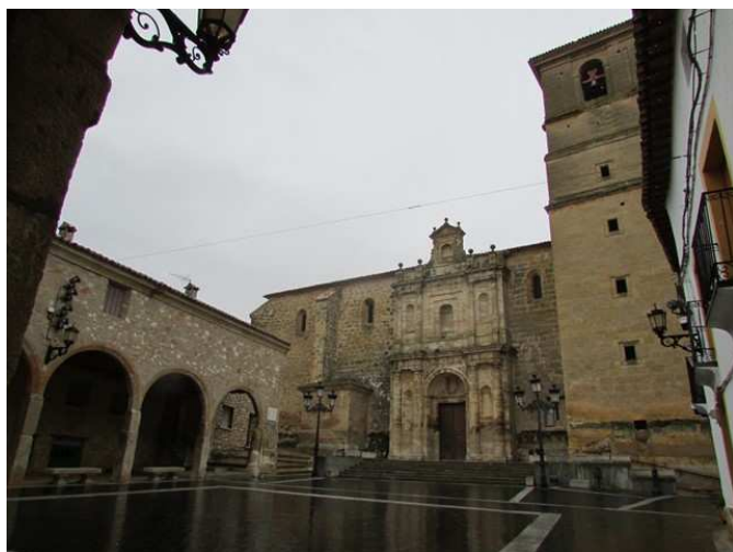
Iglesia y plaza de Buendía