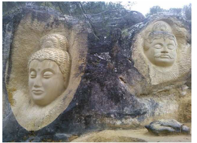
El pantano y algunos ejemplares de las esculturas de las Caras de Buendía