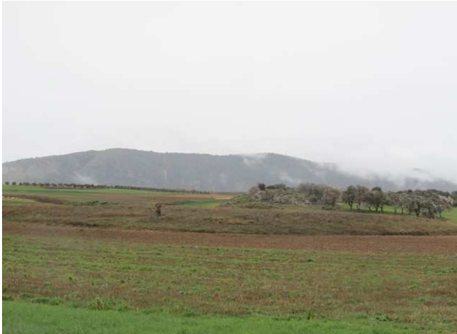
Campos de labor que acompañan la ruta