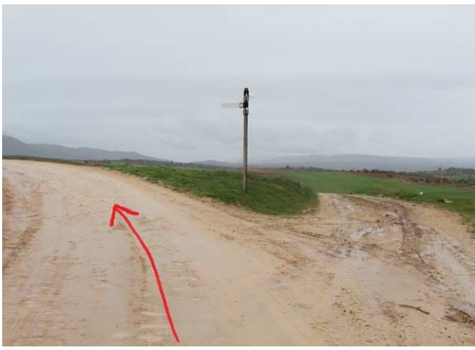
Segundo cruce a tomar a la izquierda