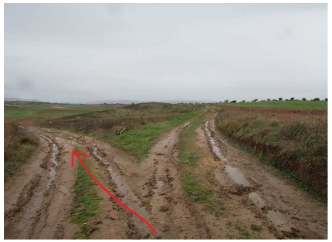
Siguiente cruce a tomar a la izquierda