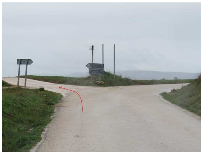
Primer cruce a la salida de Buendía