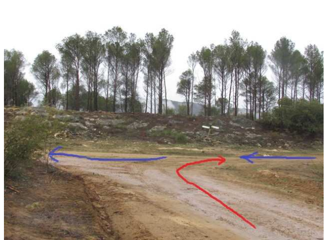
Cruce para ir al Mirador del Embalse