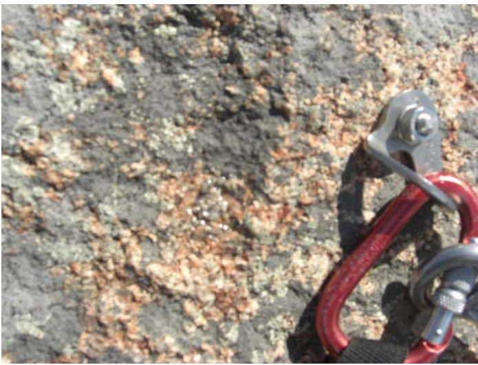
Uno de los nuevos anclajes (Parabolit M-10) y agujero recién tapado