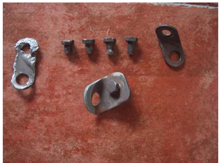
Los mismos anclajes vistos con otro perfil