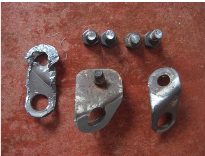
Chapas, Tornillo de Spiti y Tornillos buriles extraídos. Se observa óxido en capa exterior pero buen estado aparente interior