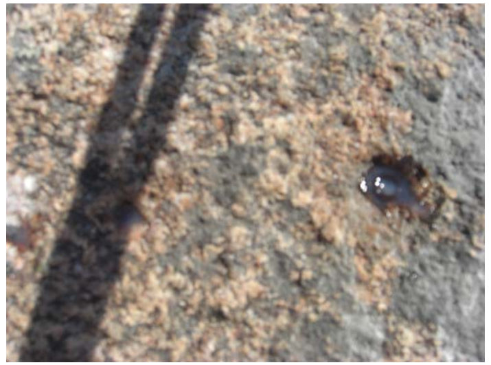
Taco de Spiti relleno con cola de dos componentes