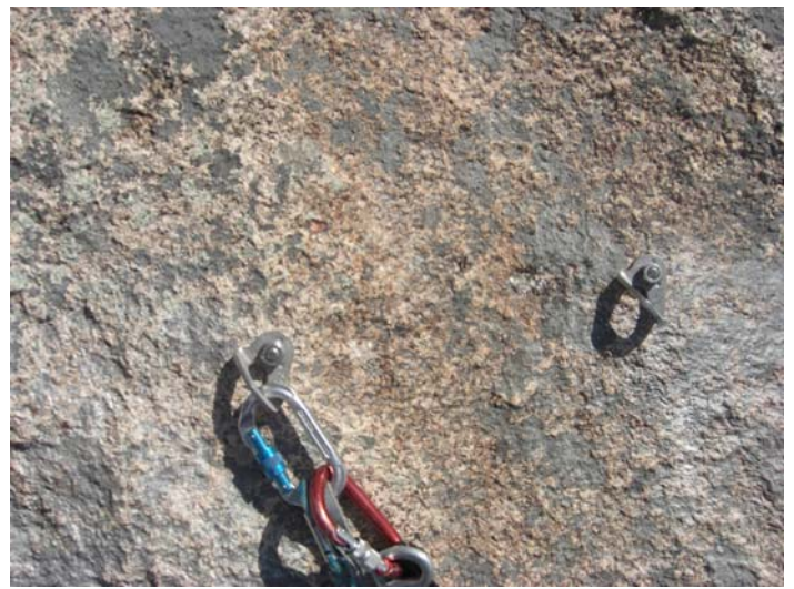
Los nuevos anclajes ya ubicados y antiguos agujeros ya tapados