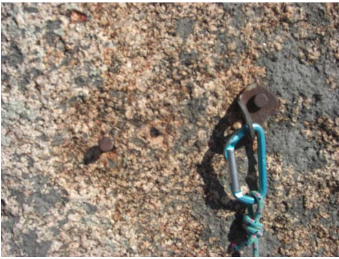
Anclajes antiguos de la 2ª Reunión (1 Butil y un Spit con chapa 8mm)