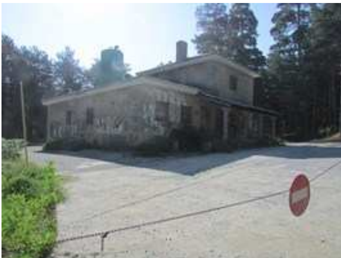
Alto del Mojón – Caseta de peones Camineros