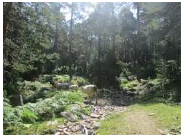
Final de la pista y giro a derecha a ascender por el bosque bordeando Navalazor