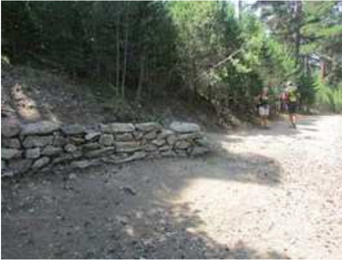
Llegada a la Fuente de la Fuenfría