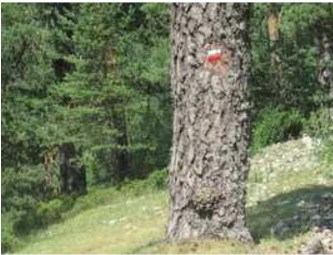
Señalización del GR-10 bajando de Fuenfría