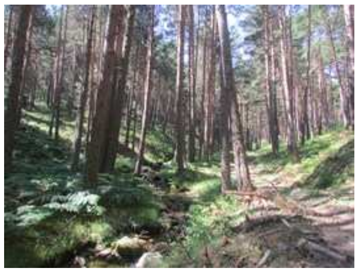
El sendero entre los pinares de Valsaín