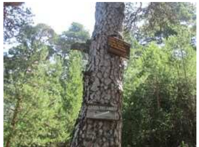
Cruce con la Senda Schimdt, que nos llega por la izquierda y continuamos a la derecha