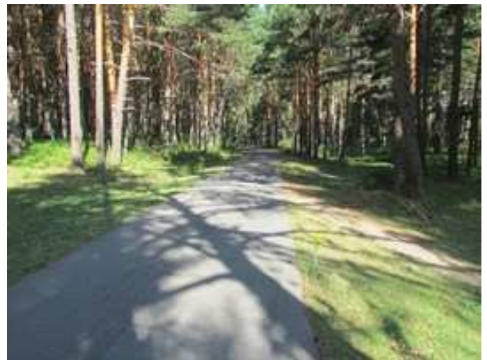
Inicio de la ascensión