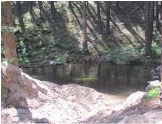
Pequeña charca del Arroyo del Telégrafo