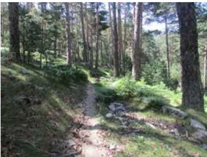
Cruce con el Carril del Gallo. Tomamos a la derecha