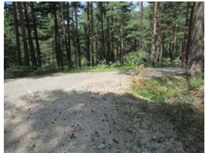
Pista final, próximo a la llegada a la carretera