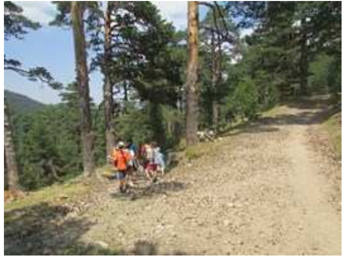
Tomando el GR-10 de regreso por la izquierda