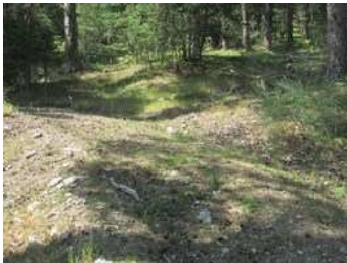
Pista de la izquierda a ascender hacia Navalazor