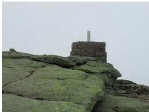
Cumbre del Pico Calvitero o Torreón (2.401 m)