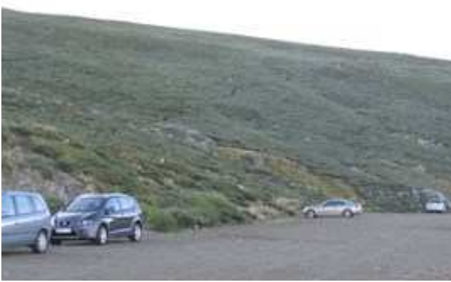
Aparcamiento e inicio de la ruta