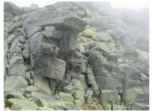
El Paso del Diablo visto desde la cumbre del Torreón