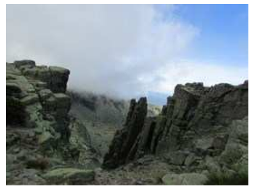
Zona llamada Las Agujas