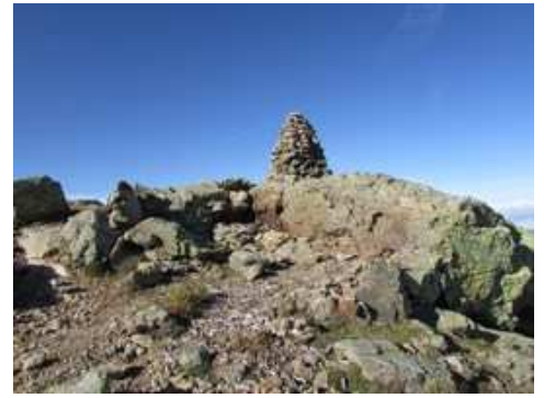
Hito de referencia en la Cuerda del Calvitero