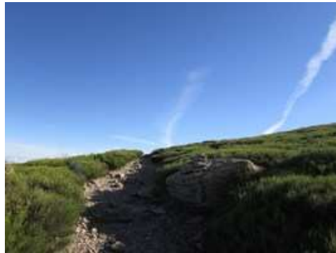
Ascendiendo por la loma