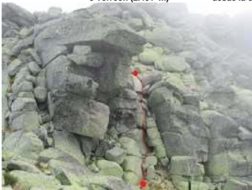
Vista detallada del llamado Paso del Diablo