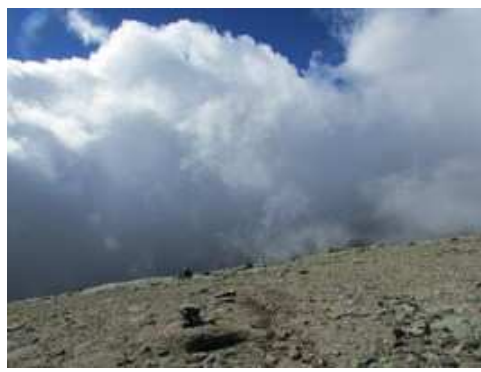
Descenso de la cumbre del Canchal de la Ceja