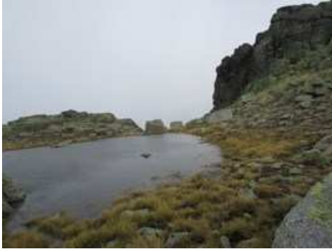
Zona de las Charcas de Venerofrío