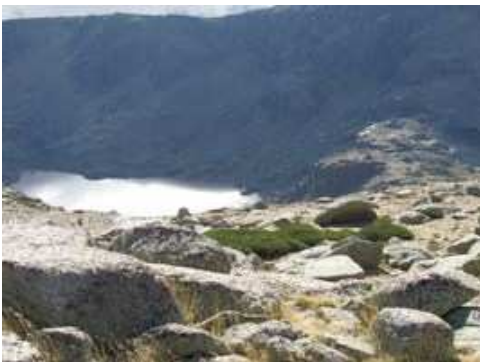
Laguna del Trampal