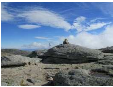
Cumbre del Canchal de la Ceja (2.430 m)