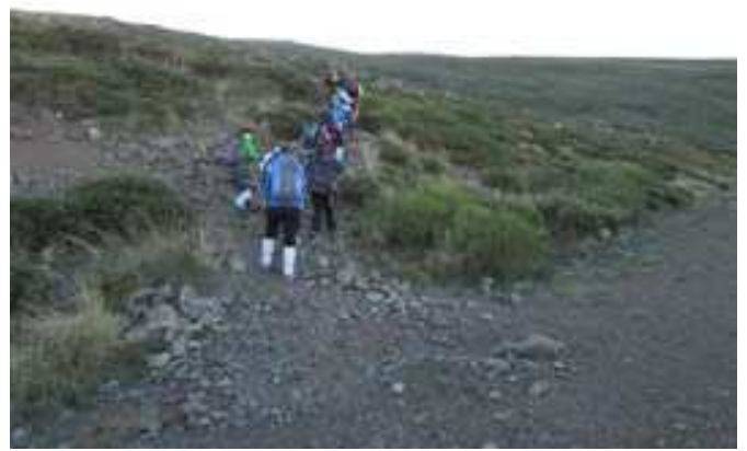
Inicio de la ascensión