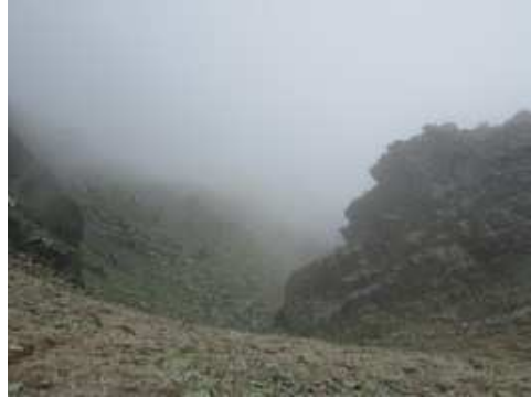
Zona de la Cueva de Hoya Moros