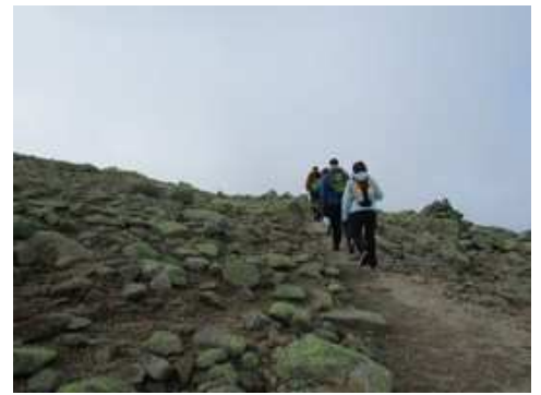
Ascendiendo al Canchal de la Ceja