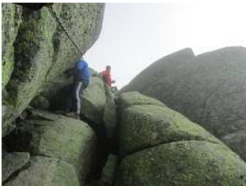
Descenso del Paso del Diablo