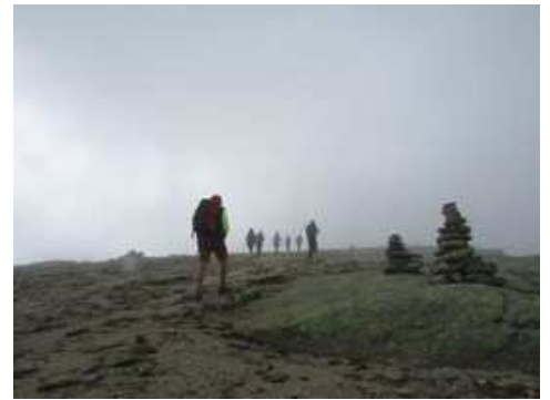
Ascendiendo las placas de Cumbre de Talamanca