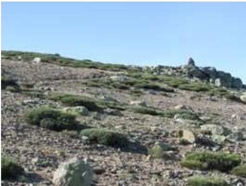
Sendero marcado por hitos