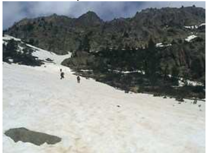
Nevero próximo a las laderas de Bachimaña