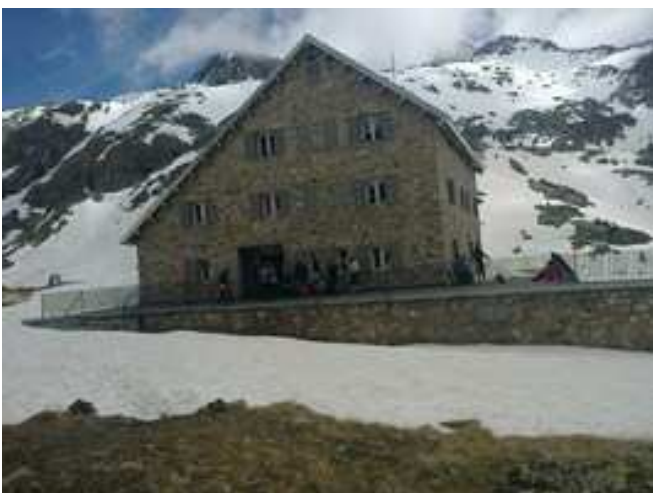
Vista del Refugio de Bachimaña