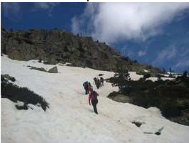
Ascendiendo por la Cuesta del Fraile