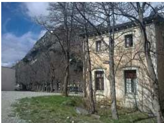
Casas en los Baños de Panticosa