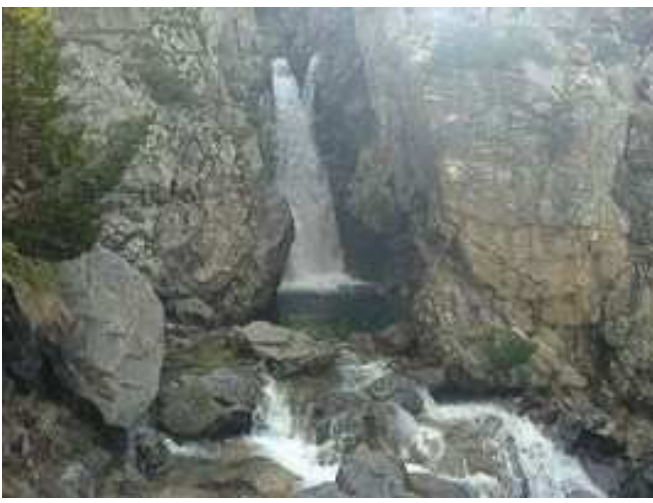
Cascada del Pino