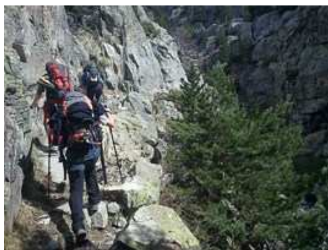
Inicio de la ascensión por el GR-11