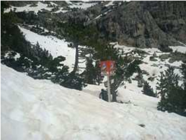
Aviso de cruce por zona de aludes