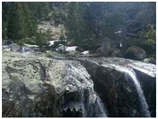
Parte superior de la cascada