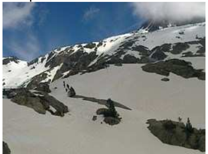
Vistas de la zona