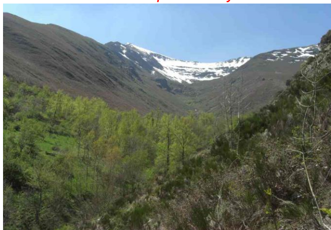
Valle del Arroyo Silencio