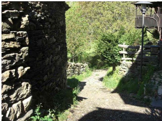
Bajada al Arroyo Montes en Montes de Valdeueza