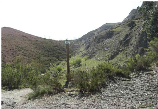
Inicio a Chano Collado por el Arroyo Pº Tuerto