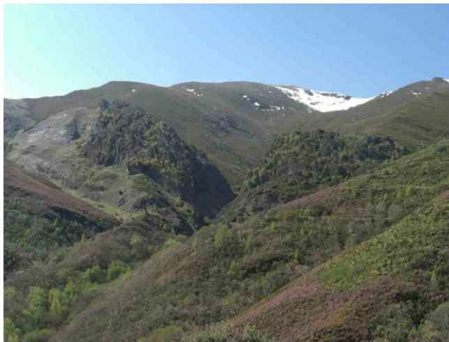
Vista del Valle que forma el Arroyo Pico Tuerto