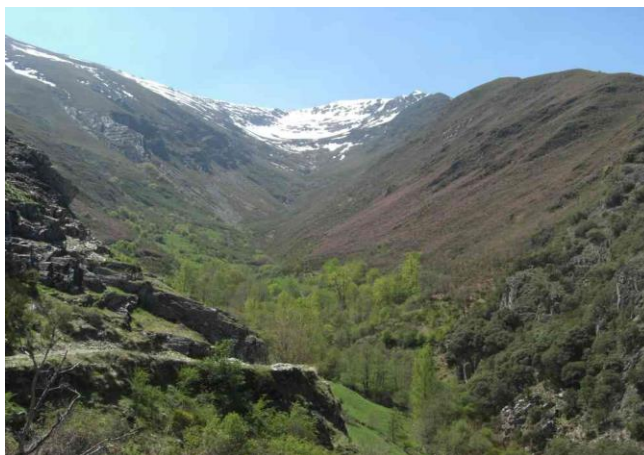
Valle del Arroyo Friguera