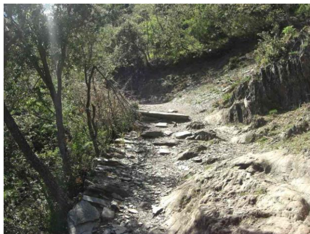
Vistas de dos tramos de la pista entre Herrería y Montes de Valdueza con los Aquilianos al fondo.