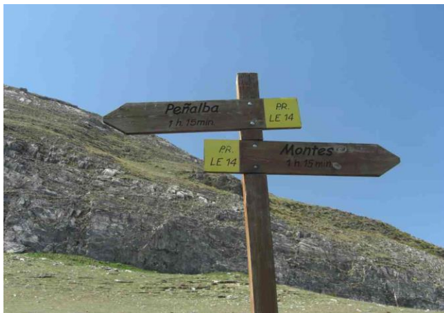
Señalizaciones en el Chano Collado